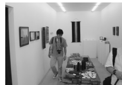
写真3 アトリエとして活用

替えた方が安くつくにも関わらず、あえて古い建物の柱などをうまく活用していました(写真2)。なんて無駄なことをしているのだろうと思うかもしれ