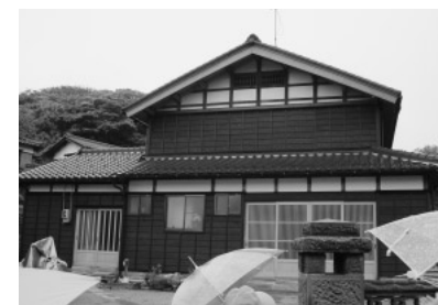
写真7 意匠を合わせて新築された家