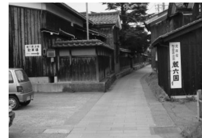
写真5 加賀市橋立のまちなみ

かつて、日本一裕福な村といわれ、北前船主の館が点在する蔵六園~北前船資料館までの間は、歩いて楽しくなるように道が笏谷石風(※)に整備されています(写真5)。家の造りは、妻入りの特徴がみられ、新築する際にもその建築様式、色調で建てられていました(写真6、7)。また、重要伝統的建造物群保存地区(※)への選定に向けて住民が合意形成を図っていること、ボランティアによるまちなみ案内の取組みが行われていること、そうした住民の活動を市がバックアップしていることなど、市と地域住民の一体感が感じられました。