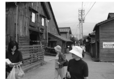
写真1 大野地区もろみ蔵