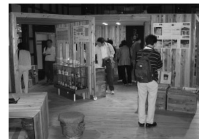
写真2 直源醤油のもろみ蔵の活用