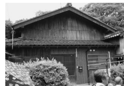
写真6 橋立の北前船主の家