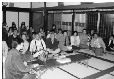
写真9 行政職員参加型市民活動2

によって、初めて住民のパワーを引き出すことができる。机上の構想を描いているだけでは、人はだれも本当には動かない」との苦言もありました。