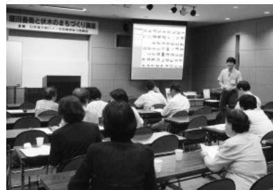
写真8 行政職員参加型市民活動1

富山県人は、他人任せ（役所任せ）なのか現実主義なのか、住民からの盛り上がりによる「まちづくり」がなかなか進まないようです。景観に関しては、このまま手をこまねいては、取り返しがつかなくなります。そこで、動かない、富山県民を動かすため、「市民参加型行政」を飛び越し、県職員も現場に出て市民と一緒に考え行動する「行政職員参加型市民活動」を実践しませんか（写真8、9）。ある市民からは「行政職員も住民の一人でもある。住民としてまちのことを考え、行動すること