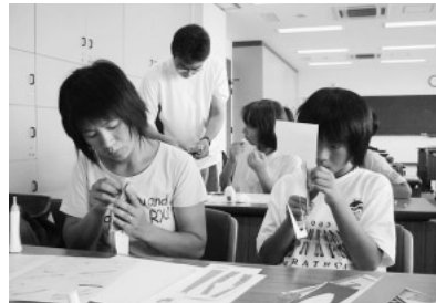
写真11 ゆめ航海工作