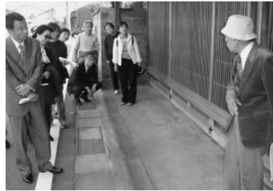
写真10 まちなみウォーク

最後に、右の教訓をお伝えして、終わりにさせていただきます。2号にわたり、ご精読ありがとうございます。